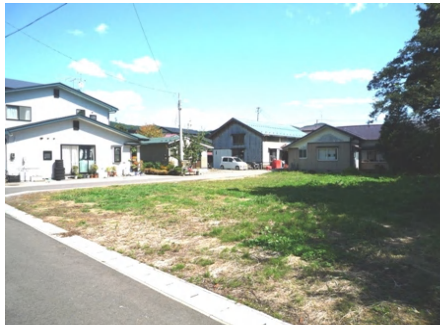
神社隣接の閑静な住宅街